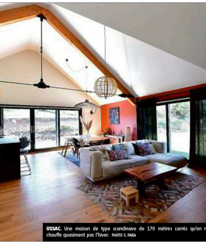
USSAC. Une maison de type scandinave de 170 mètres carrés qu'on ne chauffe quasiment pas l'hiver.

Regardez cette vue imprenable sur la vallée », décrit Dominique Bentejac, fondateur de l'agence Destin de Pierre.