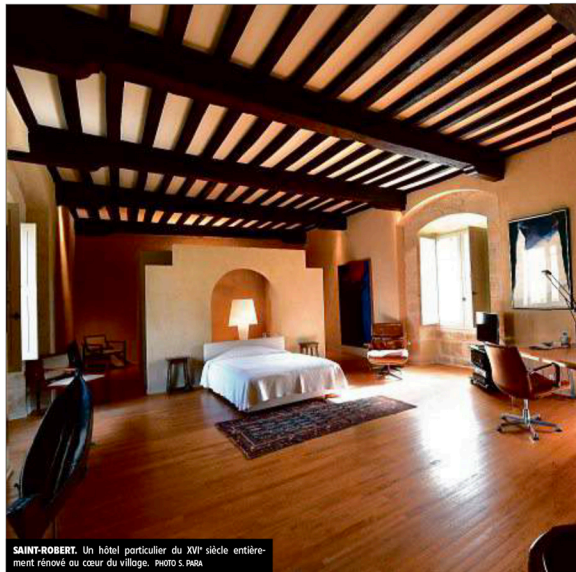
SAINT-ROBERT. Un hôtel particulier du XVII e siècle entièrement rénové au cœur du village.

3 La plus chic. Derrière cette splendide porte cochère, au cœur du village de Saint-Robert, un hôtel particulier de 300 mètres carrés entièrement rénové, appelé château de Sanzoles ou Maison Sens. L'entrée se fait au pied d'une tour carrée qui cache un impressionnant escalier à vis en pierres. Au rez-de-chaussée une pièce de vie étonnante sous une voûte de pierre blanche ouvre sur un charmant « jardin de curée », à l'abri des regards et du vent. « Cet extérieur permet des coûts d'entretien maîtrisés.