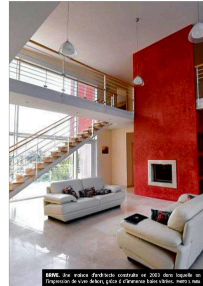
BRIVE. Une maison d'architecte construite en 2003 dans laquelle on a l'impression de vivre dehors, grâce à d'immenses baies vitrées.

Profil. Quels clients pour ces biens hauts normes ? « Il y a une clientèle qui vient des grandes villes mais il y a aussi une clientèle locale », assure Mylène Moula. Leur point commun à tous : « une très grande exigence ».