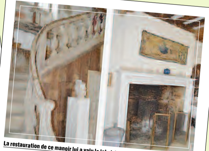
La restauration de ce manoir lui a valu le label de la Fondation du patrimoine.