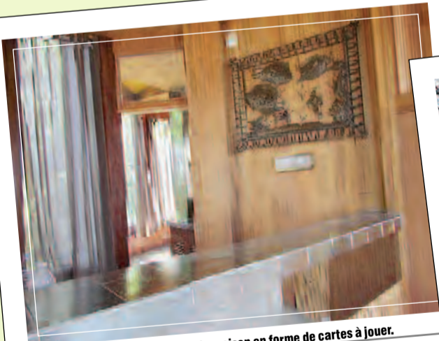
Un intérieur très seventies pour la maison en forme de cartes à jouer.

Contact : Didier Bénard, agence Patrice Besse, 06 70 75 11 22 ; d.benard@patrice-besse.com