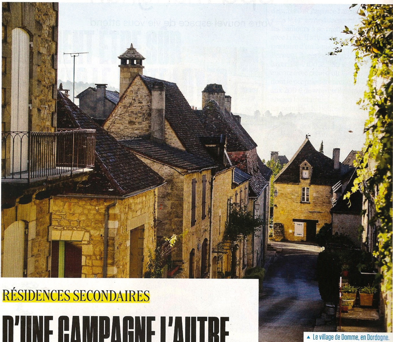
▲ Le village de Domme, en Dordogne.