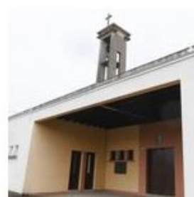
L'église Saint-Éloi de Vierzon, à vendre.

Toujours est-il que ces biens ne sont pas faciles à vendre. «L'année dernière, nous avons vendu des églises de 100.000 à 200.000 euros en moyenne», souligne Patrice Besse. «Mais l'acquéreur doit généralement prévoir plus de 200.000 à 300.000 euros de travaux.» Difficile, en outre, de faire abstraction du rôle historique de tels monuments dans un projet de rénovation . Un poids de l'histoire dont se délestent malgré tout certains repreneurs. Parmi les destins curieux, celui de l'église Saint-François-d'Assise, à Vandœuvre, près de Nancy, convoitée par la chaîne de fast-food KFC , suscite l'émotion des riverains. Quant à l'église Saint-Éloi de Vierzon, un temps promise à une reconversion en mosquée , son sort défraie la chronique depuis des semaines.